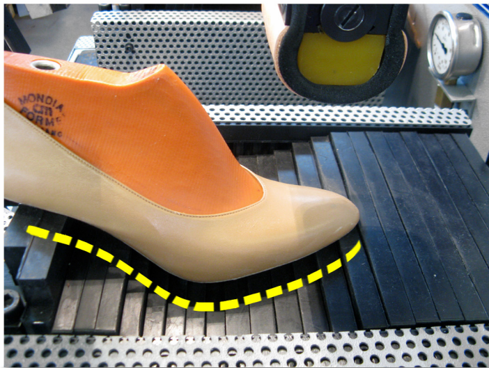
Controllo dei settori per il mantenimento della sagoma Sector pads control for shape keeping