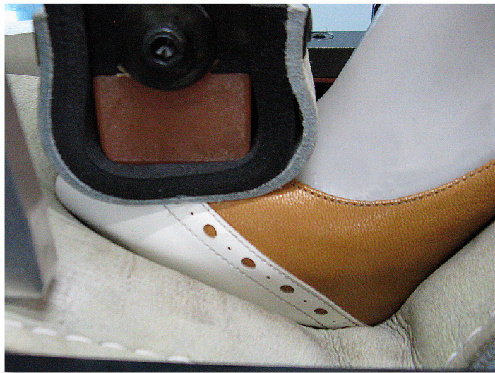
Cuscino gonfiabile per soles Opanka e Jourdan Inflatable cushion for Opanka and Jourdan soles